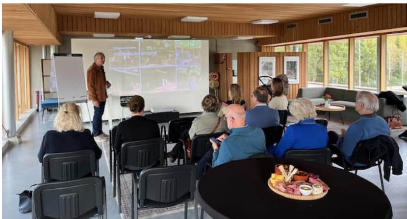
Figuur 2 Impressie informatiebijeenkomst

Project LUCX is een laagdrempelige locatie waar horeca, spel, recreatie en sport worden gecombineerd. Er zal een paviljoen worden gebouwd met een open karakter dat bestaat uit veel glas met verticale stijlen en een grote overstek. Het gebouw