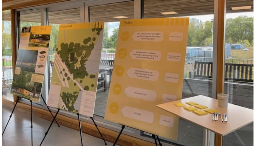
Figuur 3 Impressie panelen

Om geluidsoverlast vanaf de Insulindelaan te beperken voor bezoekers zal een geluidsscherm gerealiseerd worden, dit geluidsscherm zal aan de ene zijde (kant Insulindelaan) worden uitgerust met planten (bijvoorbeeld ECO Soundblock) en aan de andere zijde met een klimwand. Parkeren is deels afgekocht en zal verder worden opgelost met bestaande parkeerplaatsen conform regelgeving gemeente Eindhoven. Er is voor deze locatie betaald parkeren aangevraagd van 8 tot 10 uur, zoals ook aan de Javalaan geldt. Fietsparkeren zal ruim worden gefaciliteerd bij de hoofdentree.